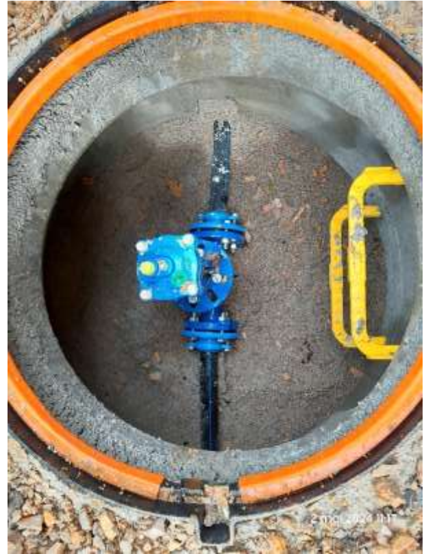
Impasse Mathieu : ventouse posée.