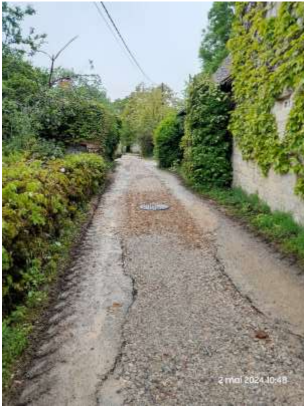
Impasse Mathieu : Tranchée remblayée.