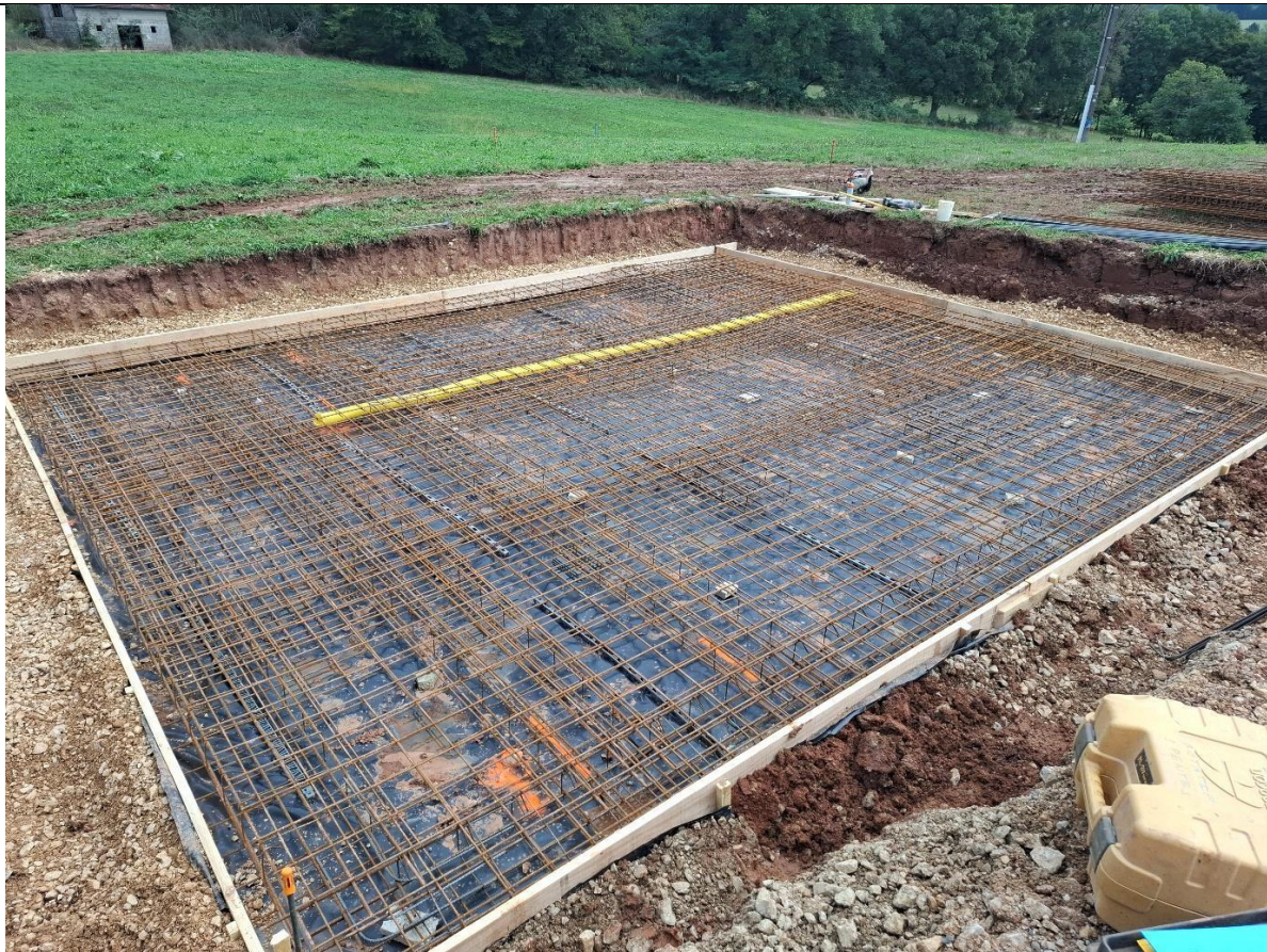
Coffrage et ferrailage de la dalle de fondation