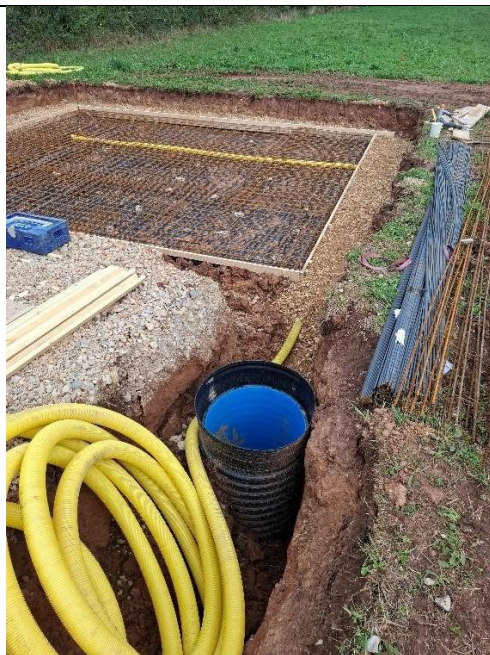
Vue du drain