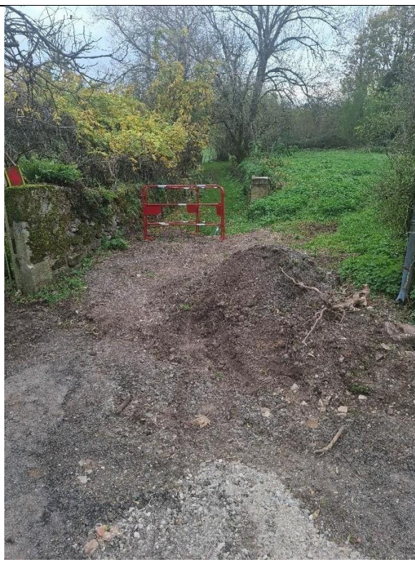
Remblaiement passage Farral avec conduite en PEHD en attente pour raccordement