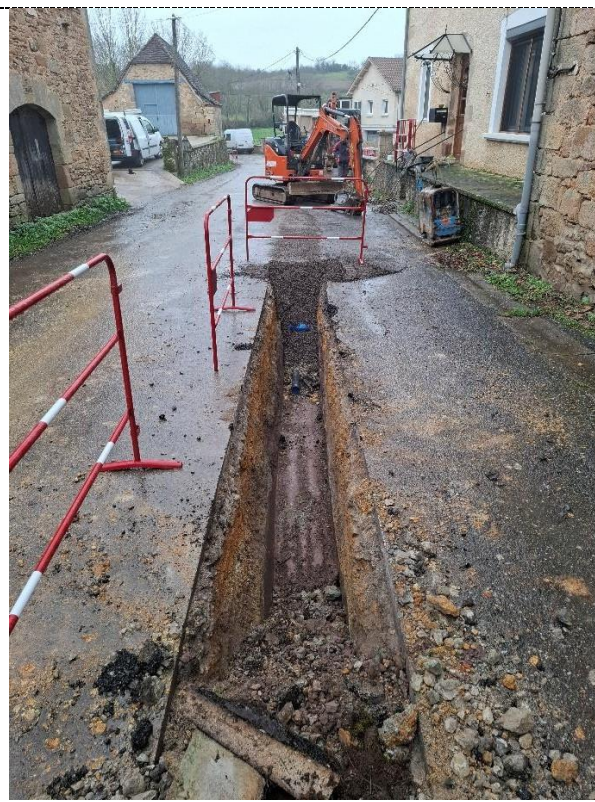
Pose en cours PVC 75mm route de Rueyres