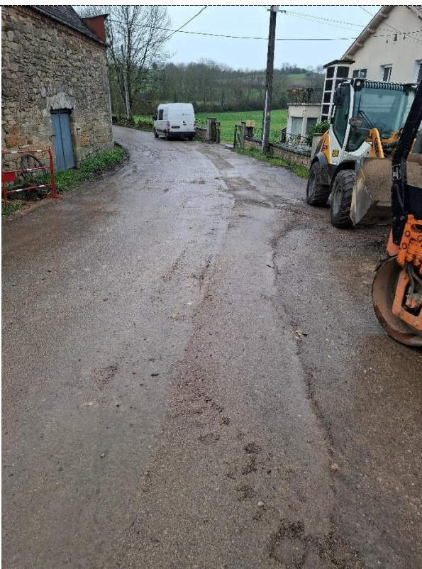
Partie remblayée route de Rueyres