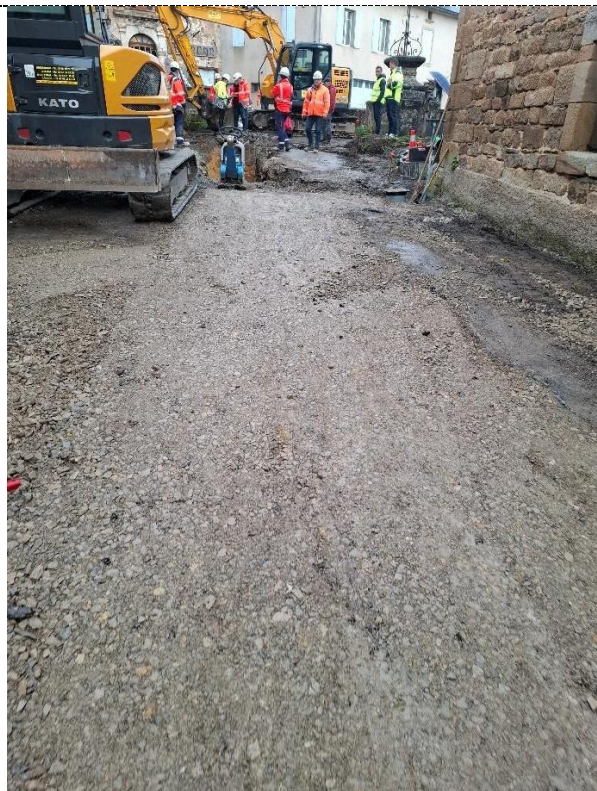
Partie remblayée rte du stade