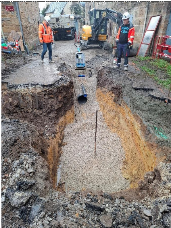
Tranchée commune PVC 110mm rte du stade