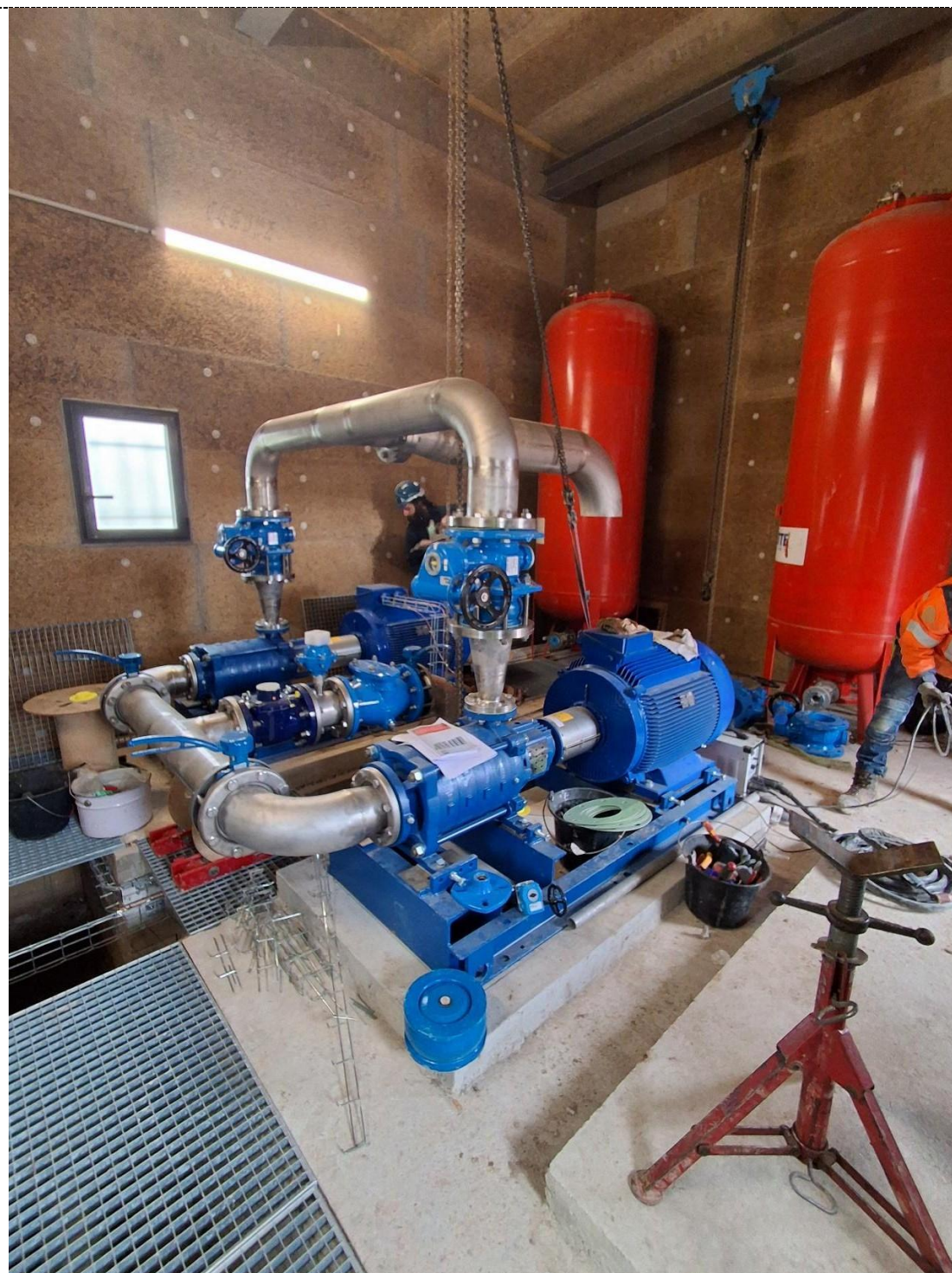
Vue intérieure de l'ouvrage