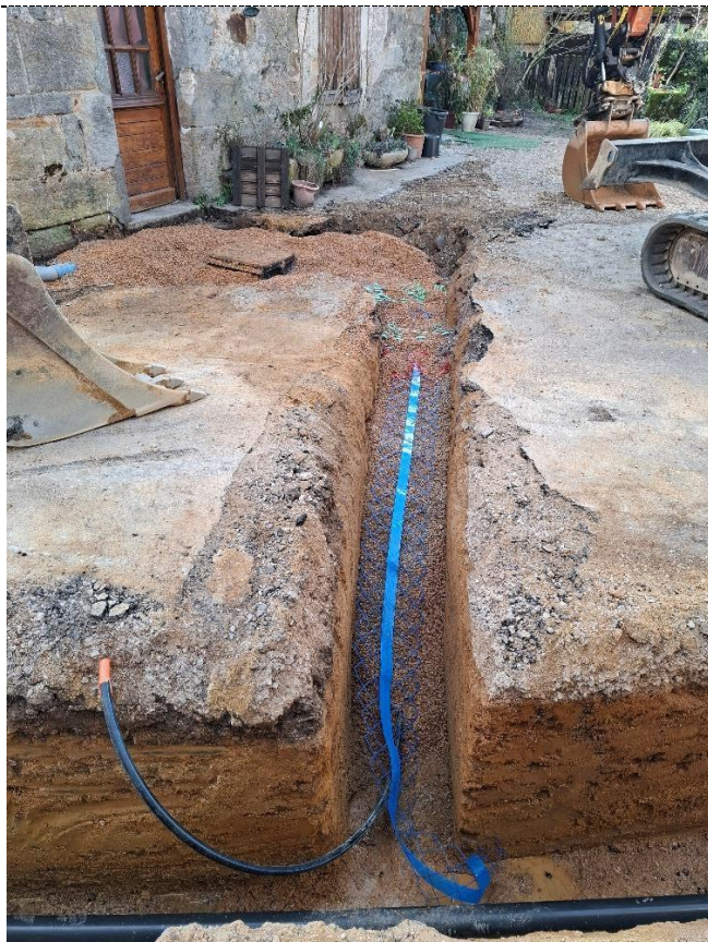
Branchement du café