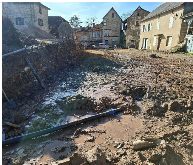
Conduite existante accrochée et réparée