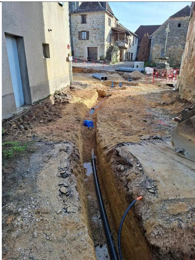
Conduite en PVC 90mm vers la place