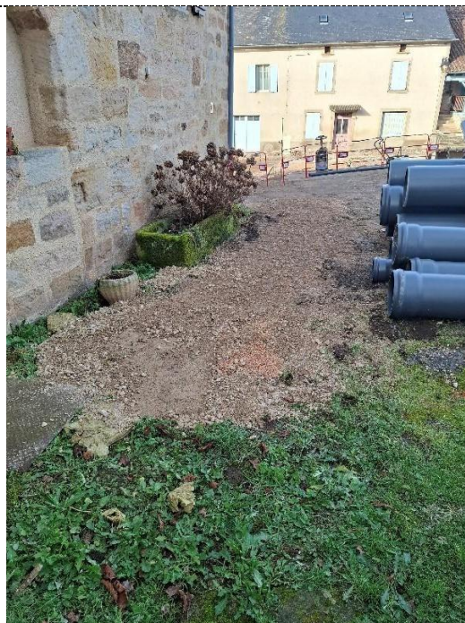
Branchement parcelle 243 à compacter