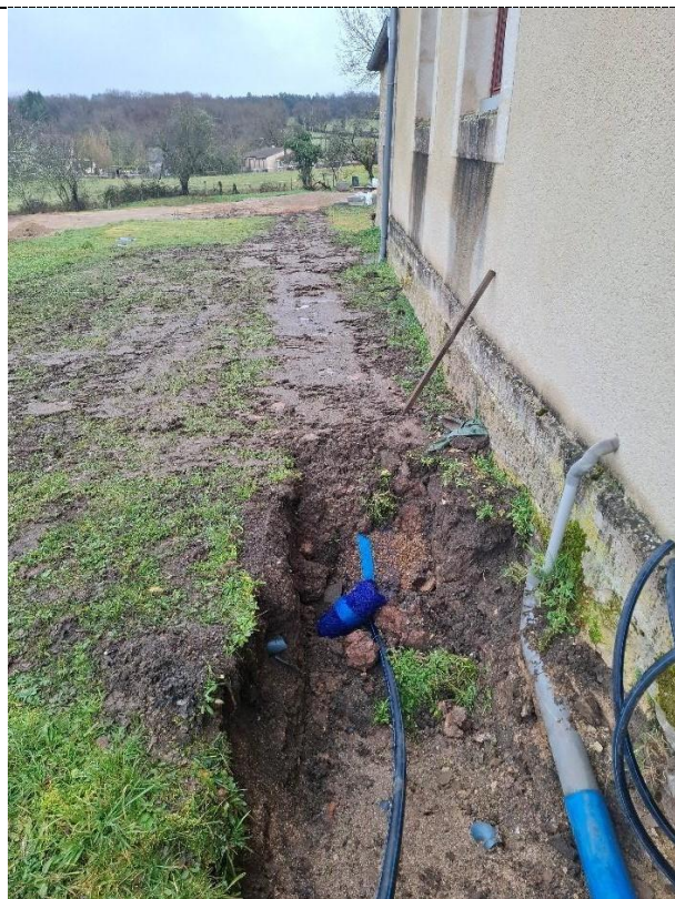
Antenne en 40 pour alim. 3 brchts de l'ancienne école