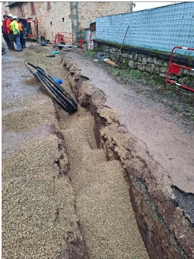
Pose conduite en PEHD 50 vers RN 140