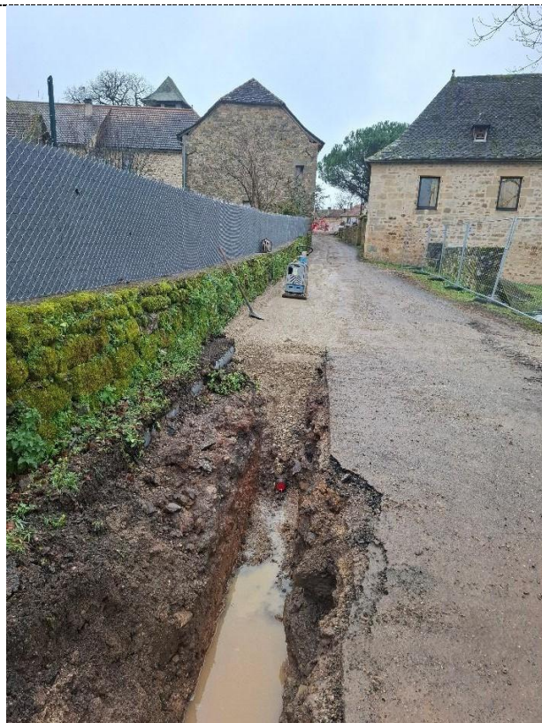
Pose conduite en PVC 75 mm