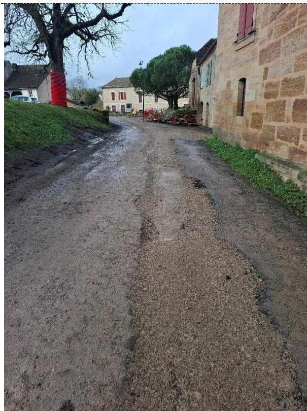
Tranchée remblayée vers la place de l'église